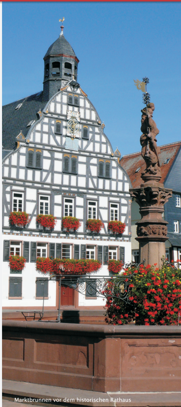
Marktbrunnen vor dem historischen Rathaus